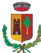
COMUNE DI ARTOGNE